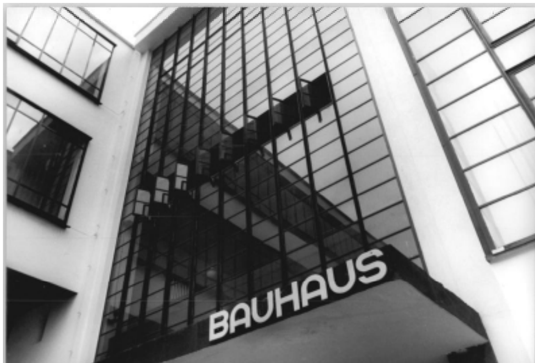
Köln 1958

... til modulære konstruksjons-sett {jf. → retoriske progymnasmata }