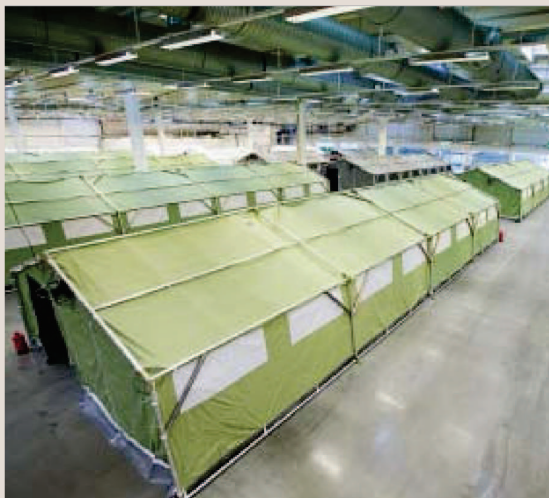
Et høyt antall flyktninger innebærer også økte offentlige utgifter fremover, så heller ikke det er et godt argument for å bruke mye mer penger nå, skriver artikkelforfatteren. Her fra teltleiren i det tidligere Smart Club-bygget ved Råde i Østfold.

Et bedre argument for å øke bruken av oljepenger neste år, er den svake konjunktursituasjonen norsk økonomi er i. Men siden de svake konjunkturerne i all hovedsak skyldes lavere oljepris og oljeaktivitet, som jo gjør oss mindre rike, er det